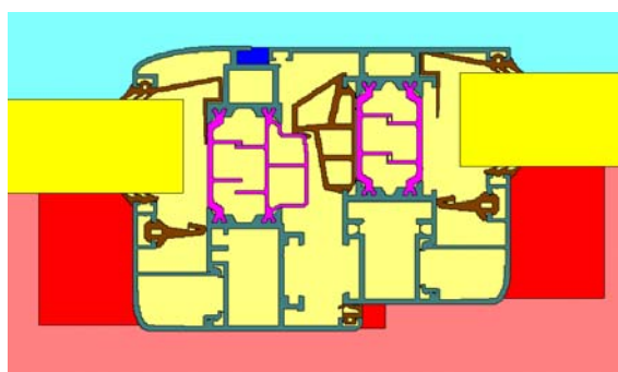
Bild 2 Simulationsmodell